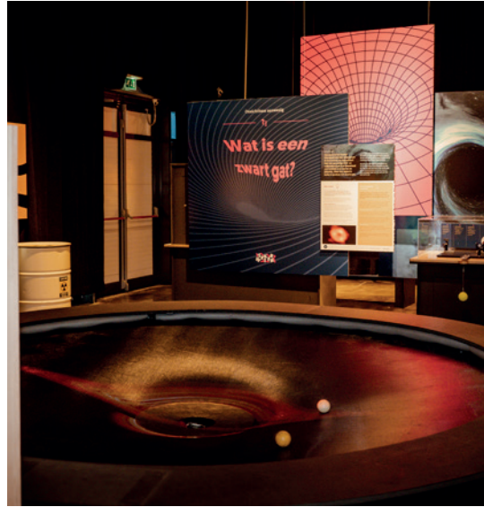
In het zwarte gat zitten rubberen balletjes die geen geluid maken als ze tegen elkaar botsen.