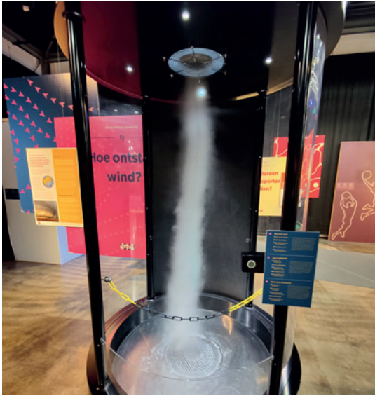
Deze windhoos maakt een zacht ruisend geluid.