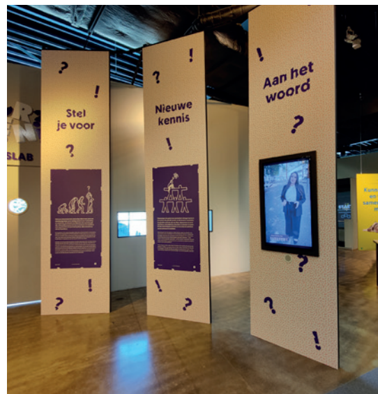
De film die hier wordt weergegeven, bevat geen geluid. De tekst wordt via ondertiteling weergegeven.