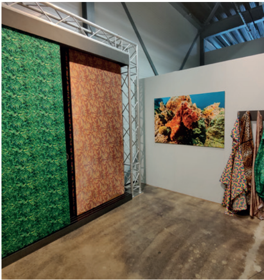
Deze panelen bevatten veel kleur.