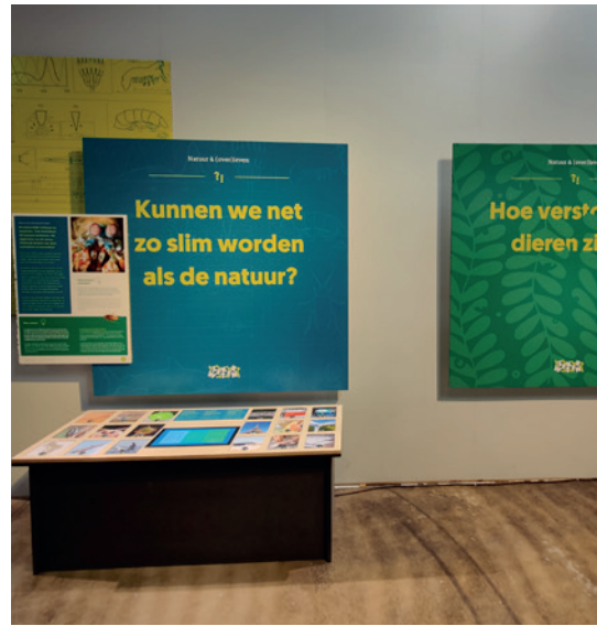
Bij deze tafel kan je op knopjes drukken. Daarna hoor je dierengeluiden.