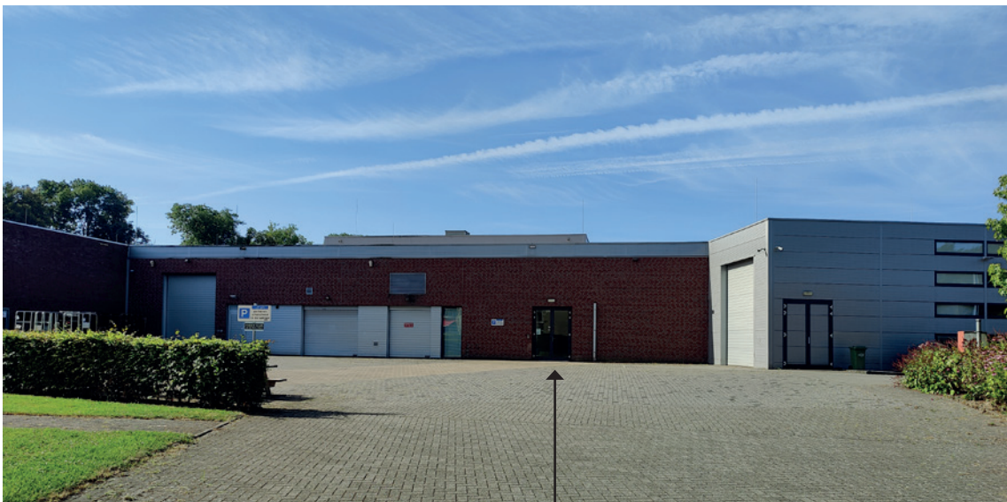
Ingang voor prikkelvriendelijke ochtend

Hieronder zie je hoe het gebouw eruitziet. De ingang bevindt zich in het midden van het gebouw en is hieronder aangegeven met de pijl in de foto.